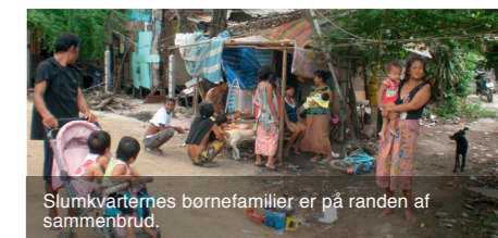
Slumkvarternes børnefamilier er på randen af sammenbrud.

barndom. Vi kan sammen hjælpe børnene ved at støtte CPDC. Det kan vi gøre ved at øremærke vores bidrag ved at skrive "CPDC" på indsendelsen af bidraget. Sammen kan vi gøre en forskel for at hjælpe børnene ud af et erhverv, de aldrig burde have været en del af. ■