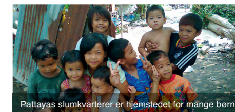
Pattayas slumkvarterer er hjemstedet for mange børn.

Sexindustrien tjener penge på børneprostitution, og tilbage står CPDC som en af de få børneorganisationer i lokalområdet, der kan hjælpe børnene tilbage til en normal