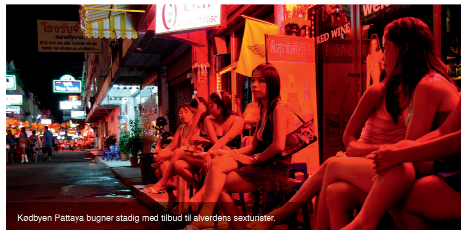
Kodbyen Pattaya bugner stadig med tilbud til alverdens sexturister.