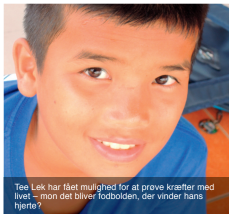
Tee Lek har fået mulighed for at prøve kræfter med livet – mon det bliver fodbolden, der vinder hans hjerte?