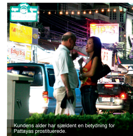
Kundens alder har sjældent en betydning for Pattayas prostituerede.

Har børnene i Thailand stadig behov for vores hjælp? I dag er Thailand ikke længere et uland, men et andet verdensland. Prostitution er fortsat med til at bringe brød på bordet, men mange prostituerede opsøger "verdens ældste erhverv", fordi det er en nem måde at tjene penge til luksusgoder. Og Thailands fattige klarer sig generelt bedre end for ti år siden. Derfor er det et oplagt spørgsmål at stille. Og svaret findes blandt andet i gadebørnsprojektet, Child Protection and Development Center.