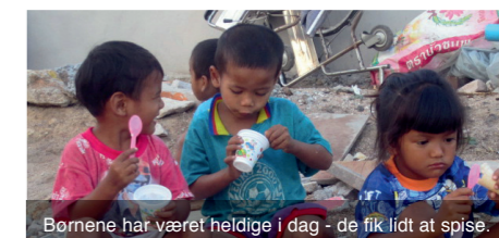
Børnene har været heldige i dag - de fik lidt at spise.